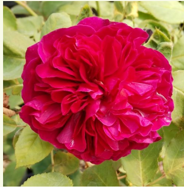
Bicentenaire de Guillot