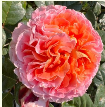
Notre Dame du Rosaire

cremefarben - nostalgierose 100-150 cm intensiv duftende, lang anhaltende rose - duftbeschreibung nicht verfügbar L. Pernille Olesen, Mogens Nyegaard Olesen