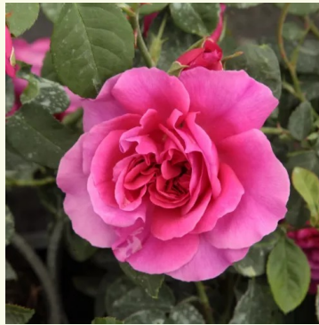
The Dark Lady

weiß-rosa - nostalgische rose 60-85 cm mild, dezent duftende rose - süßlicher charakter Alain Meilland