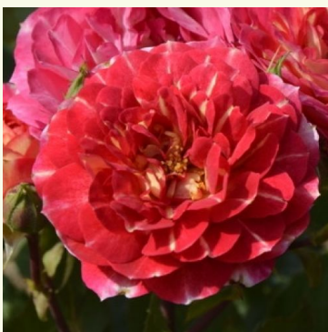
Les Potes de Bedros

rosa - nostalgie-rose 110-170 cm sehr schwach, kaum wahrnehmbar duftende rose - duftbeschreibung nicht verfügbar Alain Meiland