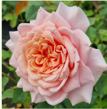
Festival des Jardins de C.