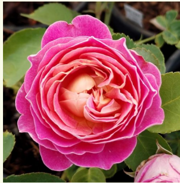
C. de l'Haÿ-les-roses

hell-rosa - nostalgierose 70-100 cm mild, zurückhaltend duftende rose - klassisch, rosiger charakter Biljana Božanić Tanjga