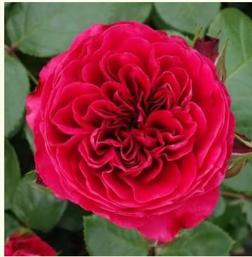
Red Leonardo da Vinci

rosa - nostalgische rose 100-150 cm intensiv, lang anhaltend duftende rose - duftbeschreibung nicht verfügbar Georges Delbard