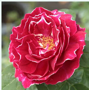
Baron Girod de l'Ain

rosa - historische, alte gartenrose 280-420 cm stark, lang anhaltend duftende rose - klassischer altrosenduft Rudolf Geschwind