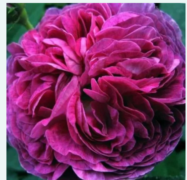
Belle de Crécy

rot - historische, remontierende hybridrose 100-150 cm sehr intensiv, den garten erfüllende rose - reich, altrosenartig Reverchon