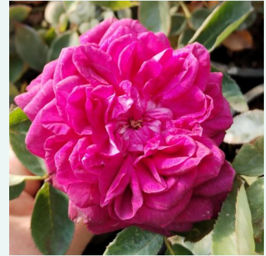
Arthur de Sansal®

weiß - historische, alba-rose 280-420 cm mittelstark, gut wahrnehmbar duftende rose - würzig, fruchtig Rudolf Geschwind