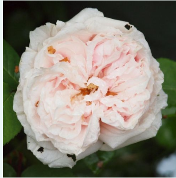
Ännchen von Tharau

rosa - historische, gallica-rose 150-210 cm stark duftende, gut wahrnehmbare rose - würzig-rosig Jean -Pierre Vibert